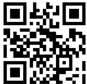
第三届急危重症小“超”人病例大赛